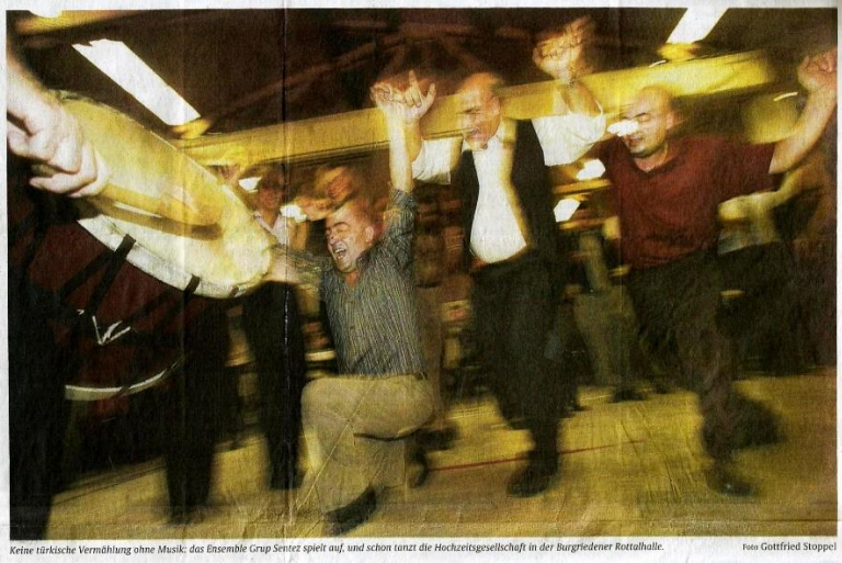
Kelise türkische Vermählung ohne Musik; das Ensemble Crisp Sentez spielt auf, und schon tanzt die Hochzeitsgesellschaft in der Burgfriedener Rottalhalle.

Almanya'daki ilk Türk müzisyenler sadece Avrupa müziğiyle ilgilendiler: Örneğin, Birinci Dünya Savaşı'ndan önce Berlin'de müzik eğitimi alan, daha sonra İstanbul Konservatuvarı müdürü olan Musa Süreyya Bey ya da 1917'de Viyana, Berlin, Dresden ve Münih'te Beethoven ve Wagner'i seslendiren Osmanlı saray orkestrası üyeleri. Ama bunlar istisnaydı. Bildiğimiz gibi "gerçek" Türkler zaten başka - yani bir şekilde oryantal olan - müzikler dinlerler.