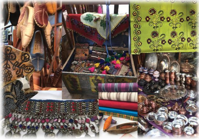
Görsel 1: Geleneksel Türk El Sanatları.

sosyal, ekonomik, toplumsal, kültürel, siyasal, sanatsal değerleri etkiler. Geleneksel el sanatları ise bu değerlerin temsil ettiği nesnelere etkileşimin bir parçası olur. İnsanlık tarihinin en eski kültürel ifade aracı olan el sanatları, doğada bulunan malzemeleri kullanılarak yapılmaya başlanmıştır. Zamanla estetik ve sembolik anlamlar kazanmış kültürel mirasın aktarıcısı olmuştur. Anadolu, zengin sanatların yaşadığı tarihi ve kültürü binlerce yıl öncesine dayanan bir coğrafyadır. Bu coğrafyada oluşan sanatlar günümüzde de geleneksel olarak devam eden birçok el sanatı barındırmaktadır. Bunlar çini, tezhip, keçe, dokuma, halı, çömlek, seramik, ebru, minyatür, yazma vb. olarak sıralanabilir (Görsel 1).