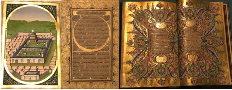
Görsel 2: Minyatür, Hat ve Tezhip örneği (Begiç ve Doğan arşivi, 2022).

sanatlarında süsleme yapmak için kullanılan sanat dalıdır (Ayan Birol,2012: 61). Hat sanatı terim anlamı, Arap yazısını estetik ölçülerle kalıba tabii tutularak güzel yazı yazma sanatıdır (hüsnü'l-hat, hüsn-i hat) (Derman,1997: 427). Minyatür sanatı ise bir resim sanatıdır. Eski yazma eserlerde metinleri açıklamaya yönelik yapılan küçük boyutlu resimler olarak tanımlanır.