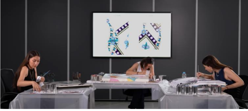
Görsel 7: Tasarım oluşturma ekibi

( https://www.youtube.com/watch?v=lyd47H4yf1Y ).