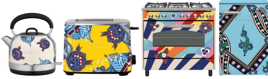
Su ısıtıcısı Ekmek Kızartma Makinesi Fırın Mini Buzdolabı