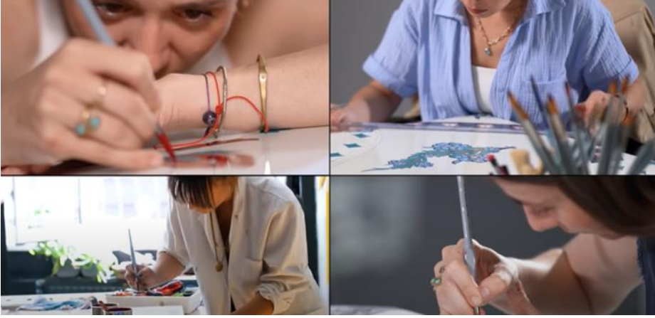
Görsel 8: Desen boyama aşaması

( https://www.youtube.com/watch?v=Iyd47H4yf1Y ).