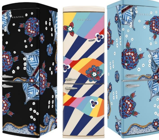
Görsel 4: Çini, Saz ve Sema motifli buzdolabı tasarımları

uygulanmıştır. Sanatçılar geleneksel teknikleri kullanarak her bir beyaz eşya parçasına özgün bir estetik ve değer kazandırmış, el işçiliği ve sanatın değerlerini ön plana çıkarmışlardır (Görsel 4).