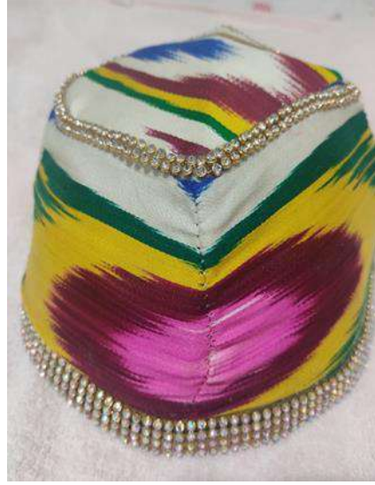
Görsel 7: Altun kadak doppa / marcan doppa” Görsel 8: Etlés doppa

Eski dönemlerde yalnızca tanınmış kişiler tarafından giyilen fakat günümüzde tiyatro sahnelerinde kullanılan ve oldukça gösterişli olan “gilem taç doppa” yuvarlak, dört kenarlı şekillerde yapılır. Üzerine geometrik şekilli işlemler yapılmaktadır. Kıymetli taşlarla süslü altın halkaya geçirilen papağan tüylerinden yapılan taç, doppanın önüne yerleştirilir (Kasimiy, 1996: 14).