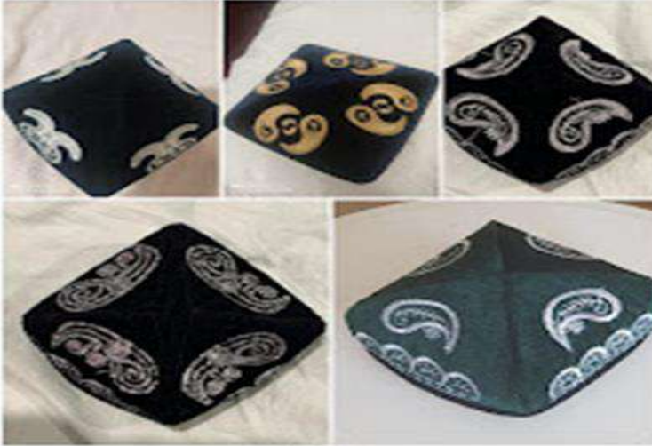
Görsel 4: Badam doppalar

Doppaların bölgesel ya da yöresel farklılık göstermesi, nicelik olarak doppa sayısının çeşitliliğiyle de açıklanabilir. Kasimiy tarafından aktarılan bilgiye göre 25'ten fazla doppa çeşidi vardır. Bunlar arasında “badam doppa”, “çimen doppa”, “gilem doppa”, “altun kadak doppa” vb. en bilinen ve en sık kullanılanlarındadır. Örneğin badem doppalar; dört kenarlı olup siyah renkteki kumaştan dikilip bu doppalara beyaz ipekten badem, nar, şeftali ya da kırmızı gül gibi motifler işlenir. Çoğunlukla erkekler giyip kadınlar arasında oldukça az rastlanır. Sincan'ın güney bölgelerinde yaygın kullanılır (1996: 13). Badam doppalar (Görsel-4), Uygurlar arasında en yaygın kullanıma sahip olup bölgelere göre adı ve badem motifinin biçimsel işlenişi değişebilmektedir. Örneğin “Yeken badam doppa” (Yarkent badem doppası), ismiyle Yarkent bölgesine ait olduğu işaretlenir. Davut'un belirttiği üzere, diğer doppa türlerine göre kenarları geniş, tepesi yüksek ve büyüktür. Badem motifleri de büyük ve dolguludur. Badem arasına alınan balık sırtı motifi kalın, nakışı tam yarım ay şekilli, tohumları tanelidir. Bu doppayı, genellikle evlenen erkekler, orta yaşlılar ve yaşlılar giymektedir ki kişiyi ağırbaşlı gösterir (2011: 37-38).