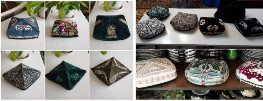
Görsel 1 ve 2: Uygur ailelerin evlerinden doppalar

Uygurların zanaatsal, sanatsal niteliklerine koşut, iletişimsel sembolik anlamların yüklenmesiyle yaşama biçimlerini, tutum ve davranışlarını, düşünme yapılarını etkileşimle değiştiren, dönüştüren ve yeniden yaratıcı etkiye sahip bir değerde olmuştur. Bu makalede öncelikle doppaların tespit edilen işlevleri ele alınmıştır, ardından bu işlevlerin tarihsel süreçten günümüze değişen küreselleşme ve kültürel değişme gibi etkenler sonucunda günümüzdeki kullanımını incelenecektir. Doppalar, tarafımızca Uygurların göç ederek bugün yaşamlarını devam ettirdikleri Türkiye, Kırgızistan, Kazakistan coğrafyalarında da gözlem ve mülakatların sonucu; doppaların kullanım alanının azalması ve kültürel değişimle gerçekleşen “işlev kaybı”na karşılık, kültürel “yeniden işlevlendirme” yaklaşımına tabi tutulacaktır. Böylelikle giysi türü olarak doppanın senkronik olarak kullanımındaki işlevler, kültür ve maddi ürün ilişkisi bağlamında görünümü sağlanacaktır.