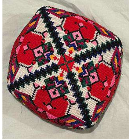
Görsel 9: Erkeklerle ait Kaşgar'ın gilem doppası Görsel 10: Kadınlara ait Kaşgar'ın gilem doppası

Giyim-kuşam ve süslenmenin gösterge olarak dinî, siyasî, statü, kimlik ve cinsiyet göstergesi olarak aktarılması kültürlerarası bir realitedir. Uygur toplumlarında kadınlar da buldukları sosyal statüye göre doppa giymeyi tercih ederler. Genç ve bekâr kadınlar, göz alıcı renk ve desenleri tercih ederken; evli veya yaşlı kadınların kimi renk ve desenleri giymekten sosyo-kültürel açıdan kaçındıkları dikkat çeker. Ekseriyetle de eşi vefat etmiş kadınların bu yönde tutum ve davranışları toplumsal açıdan da uygun karşılanmaz. Tüm bu bilgiler doğrultusunda üretim ve kullanım ilişkileri bağlamında yaş grubu, toplumsal rol ve statü, cinsiyet gibi alanlar etrafında doppaların kullanımının değişmesi; halk yaşamında doppaların sınırları çizme ya da belirme etkisine sahip olduğu anlaşılmaktadır.