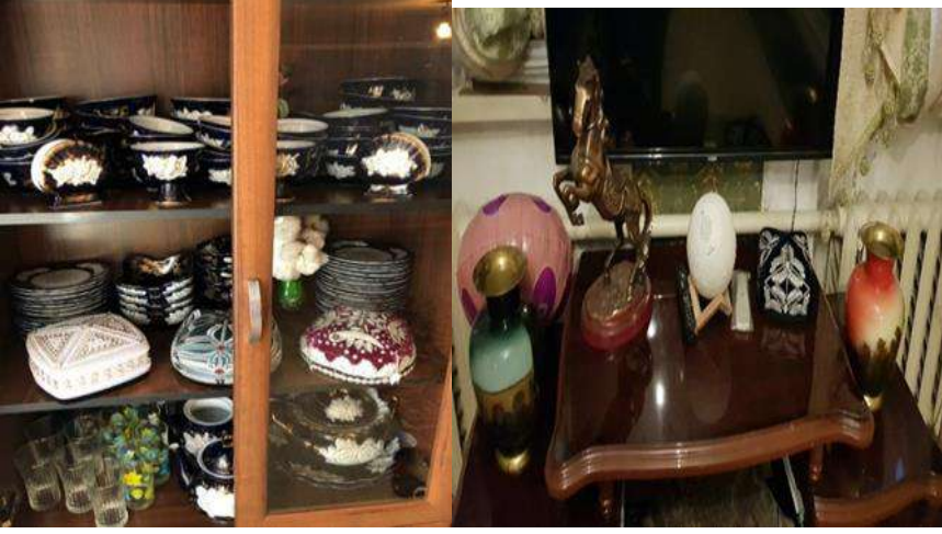
Görsel 11 ve 12: Evin mekânsal tasarımında doppa