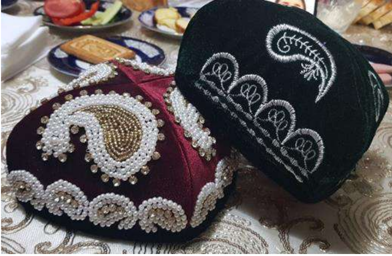
Görsel 3: Badem motifli doppalar

vadettiği hazinesini verecek olduğunda yiğit; bunu kendi bahçesinde yetiştirmediğini, Tanrı'nın nimeti olduğunu, kendisi için haram olduğunu söyleyerek kabul etmez. Padişah da onu sarayına alır. Yiğide âşık olan melike ise ona sevgisini bildirmek için doppa dikmiş ve doppa üzerine de şifalı bademi işlemiştir. Kızın âşık olmasından haberdar olan padişah ikisini nikahlamış. Sonrasında bu yurttaki âşık olan kızlar, yiğitlere sevgilerini göstermek için kendi elleriyle doppa dikerek sunmuşlardır (Davut 2011: 36-37). Yukarıda görüldüğü üzere, Uygurlar arasında en yaygın kullanıma sahip olan badem doppanın üzerine işlenen badem motifinin şifalı, iyileştirici olduğuna dair inanışları efsanelere de yansıtılmıştır. Serbest'in (2023: 204) de ifade ettiği gibi bademin veba hastalığına şifa olması; doppa nakışlarında da geçmişten günümüze sembol olarak aktarılmıştır.