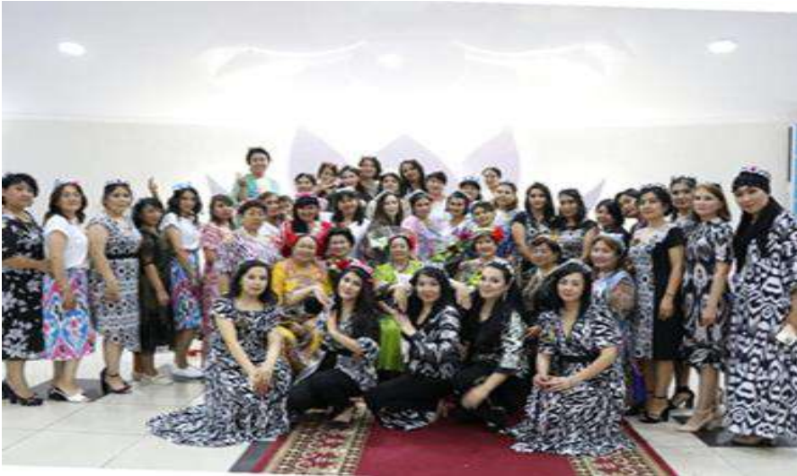
Görsel 15: Meşrep töreninde milli giyim

Doppaların yaygın olarak geçmiş dönemlerde hem gündelik yaşamın hem de tören ve özel günlerin bir parçası iken günümüzde yukarıda da bahsedildiği gibi farklı etmenler çerçevesinde – yaşlı kuşak haricinde- özellikle bayram, düğün, meşrep gibi önemli gün ve törenlerde kısmen sürdürüldüğü gözlemlenir. Ancak söz konusu bu alanlarda kullanımı ayırt edici bir biçimde özel grupların, dansçıların geleneksel giyimlerin bir tamamlayıcısı olarak görülür.