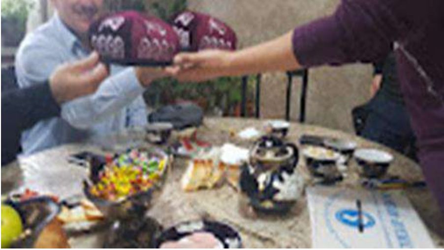
Görsel 14: Tanık olunan hediyeleşmede doppa

Doppaların yaygın olarak geçmiş dönemlerde hem gündelik yaşamın hem de tören ve özel günlerin bir parçası iken günümüzde yukarıda da bahsedildiği gibi farklı etmenler çerçevesinde – yaşlı kuşak haricinde- özellikle bayram, düğün, meşrep gibi önemli gün ve törenlerde kısmen sürdürüldüğü gözlemlenir. Ancak söz konusu bu alanlarda kullanımı ayırt edici bir biçimde özel grupların, dansçıların geleneksel giyimlerin bir tamamlayıcısı olarak görülür.