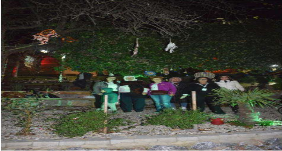
Görsel 8: Vorteks alanı olan ağaç ve altındaki kursiyerler. Beyaz başörtüsü bulunan KK-2, Boyun kartı taşıyan KK-6, KK-6 solunda yer alan KK-7. (19.11.2022, Sapanca, Yazarın Özel Arşivi).