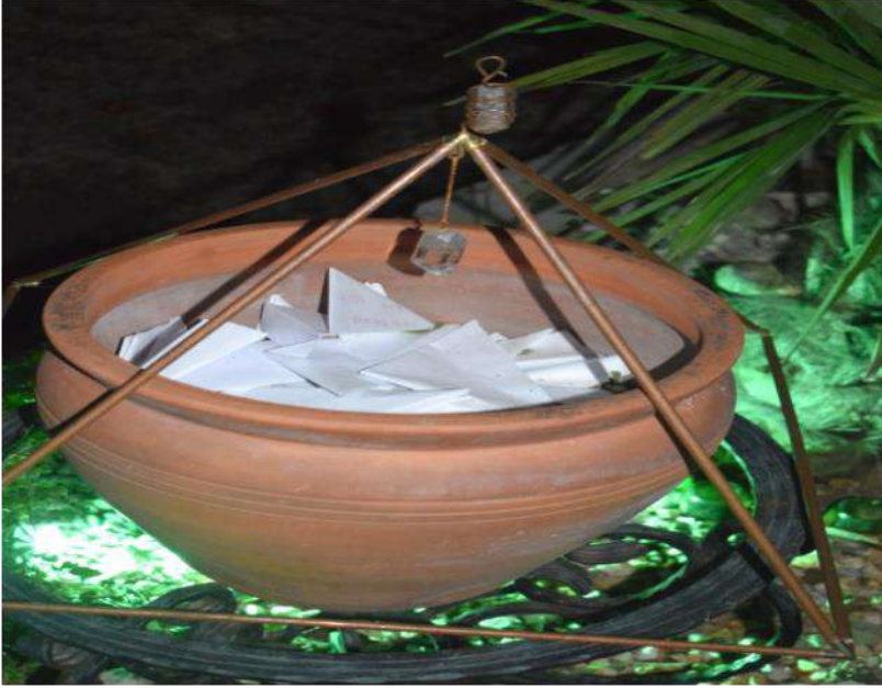
Görsel 6: Şifa köyünde, vorteks alanında bulunan dilek çanağı, bakır piramit ve kristal kuvars taşları. (19.11.2022, Sapanca,).