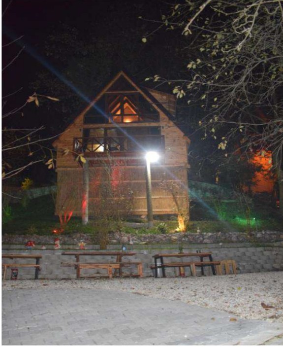
Görsel 7: Şifa köyüne girişte yer alan ilk bungalov. (19.11.2022, Sapanca,).