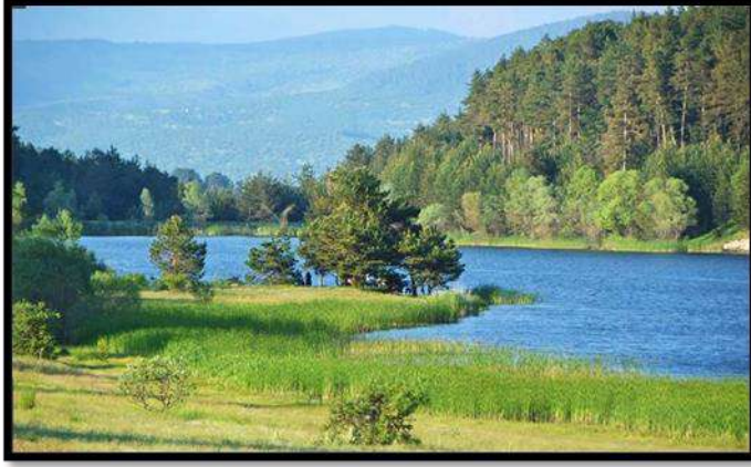
Çamlıdere, Çamkoru

Çamlıdere bir müzeler kentidir. Doğa ve Hayvan Müzesi, Kültür Evi ve Etnoğrafya Müzesi, Şeyh Ali Semerkandi Müzesi, Semerkandi Evi, Kutsal Emanetler Müzesi, Tarım Müzesi, Terazi Müzesi, Soba müzesi, Oyun ve Oyuncak Müzesi olmak üzere 9 tane müzeyi ziyarete açmıştır (KK2).