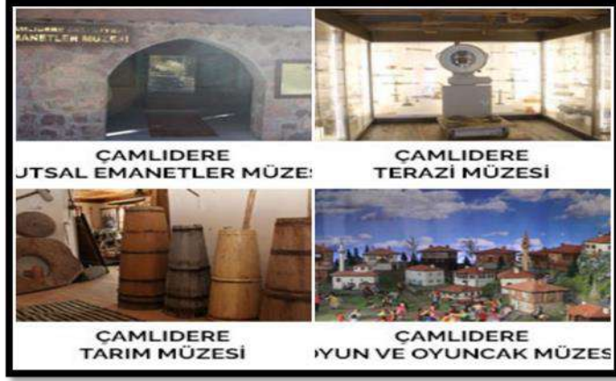
Çamlıdere müzeler (Çamlıdere Belediyesi)