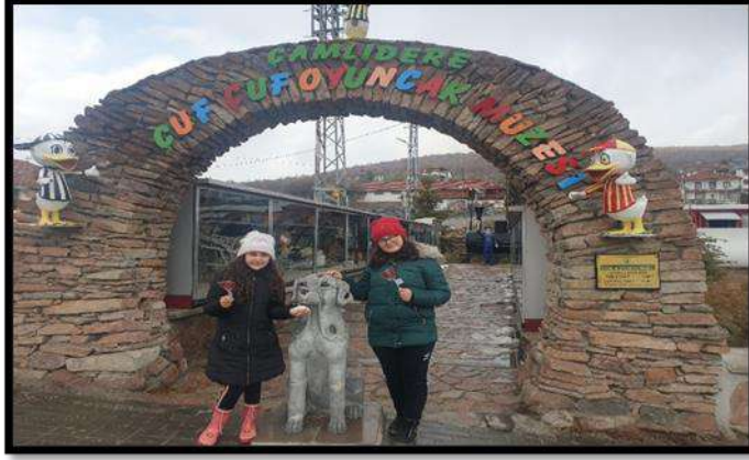
Çamlıdere, Oyun ve Oyuncak Müzesi

uğraşdır. Bu toplama, yani koleksiyon deyiminin geldiği son aşama olan müzecilik kavramı 19. yüzyılda karşımıza çıkar. Nasıl ki farklı koleksiyonların tarihsel zincirde son halka olduğunu söylersek, koleksiyon konusundaki gelişmelerin de müzecilik tarihinde son halka olduğu söylenebilir (Pomian, 2000: 17).