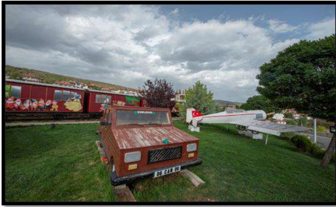
Çamlıdere, Oyun ve Oyuncak Müzesi, (Ayşe Sarıcan Arşivi)