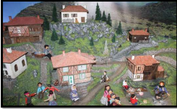
Çamlıdere, Oyun ve Oyuncak Müzesi