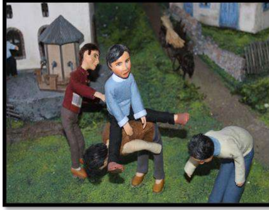
Çamlıdere, Oyun ve Oyuncak Müzesi

Oyun ve Oyuncak Müzesi, Çamlıdere Belediye Başkanı Hazım Can Ercan'ın girişimleri doğrultusunda tarihe farklı bir noktadan tanıklık eden oyuncaklar yaklaşık 20 yıl gibi bir sürede toplanıp bir araya getirilerek bulunduğu yörenin geçmiş yaşamına dair anıları yeniden canlandırılarak büyüklere nostalji, küçüklere eğlence amacı ile kurulmuş olup, ilçeye ziyarete gelenlere ücretsiz hizmet vermektedir. Müze koleksiyonun da yer alan yerli ve yabancı olmak üzere, sanayi ürünü ve el yapımı oyuncakların içinde 4.500'ün üzerinde çalışır durumda oyuncak bulunmaktadır. Bununla birlikte geçmişte oynanan kültürel oyunların maketleri de müze içinde yer almaktadır (KK1).