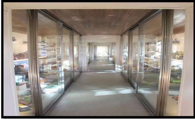
Çamlıdere, Oyun ve Oyuncak Müzesi (Ayşe Sarıcan Arşivi)

Müze de 1790 yılına ait bir İngiliz bisikleti de bulunmaktadır.