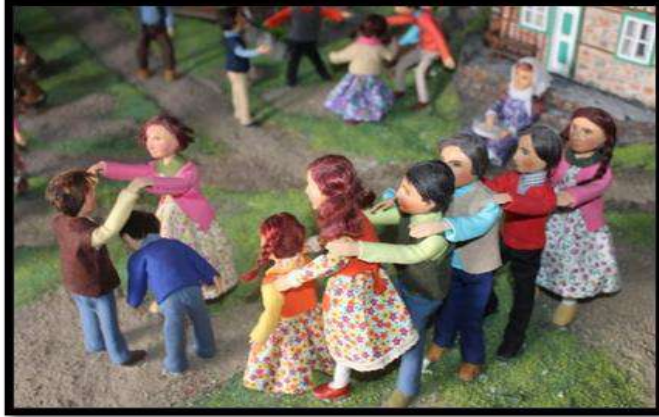
Çamlıdere, Oyun ve Oyuncak Müzesi