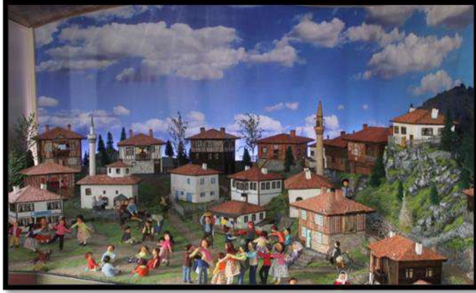
Çamlıdere Oyun ve Oyuncak Müzesi