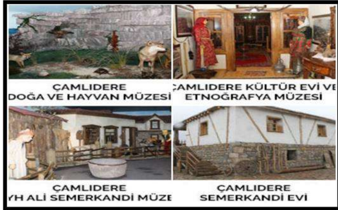
Çamlıdere müzeler (Çamlıdere Belediyesi)

Çamlıdere bir müzeler kentidir. Doğa ve Hayvan Müzesi, Kültür Evi ve Etnoğrafya Müzesi, Şeyh Ali Semerkandi Müzesi, Semerkandi Evi, Kutsal Emanetler Müzesi, Tarım Müzesi, Terazi Müzesi, Soba müzesi, Oyun ve Oyuncak Müzesi olmak üzere 9 tane müzeyi ziyarete açmıştır (KK2).