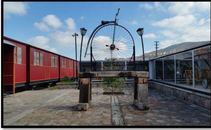
Çamlıdere, Oyun ve Oyuncak Müzesi, (Ayşe Sarıcan Arşivi)

Müze de 1790 yılına ait bir İngiliz bisikleti de bulunmaktadır.