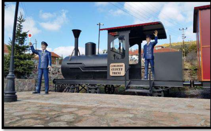
Çamlıdere, Oyun ve Oyuncak Müzesi

Müzenin giriş kısmı vagon şekline uygun olarak koleksiyonlar camekan arkasında sergilenmektedir (KK1).