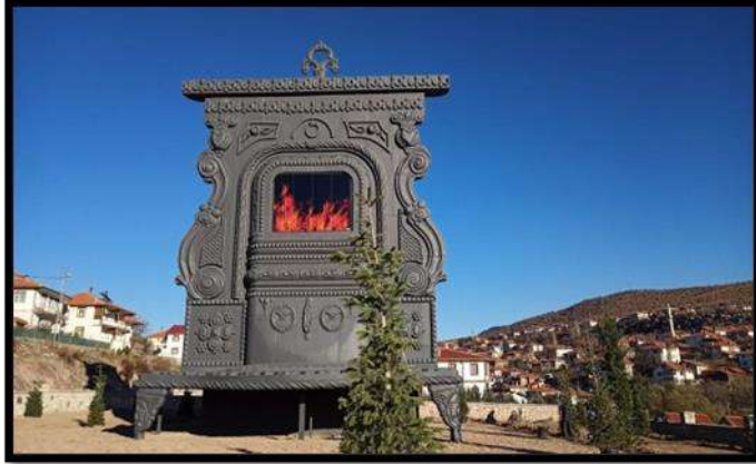
Çamlıdere Soba Müzesi (Ayşe Sarıcan Arşivi)

Çamlıdere'deki Soba Müzesi; Soba şekli verilerek yapılan Dünya'da ilk ve tek Müzedir. Çamlıdere'nin ilk belediye başkanı Hafız Halil Okur'un belediyedeki makam odasında kullandığı sobanın 22 kat büyütülmüş hali Müzeye çevrilmiştir (KK.3).